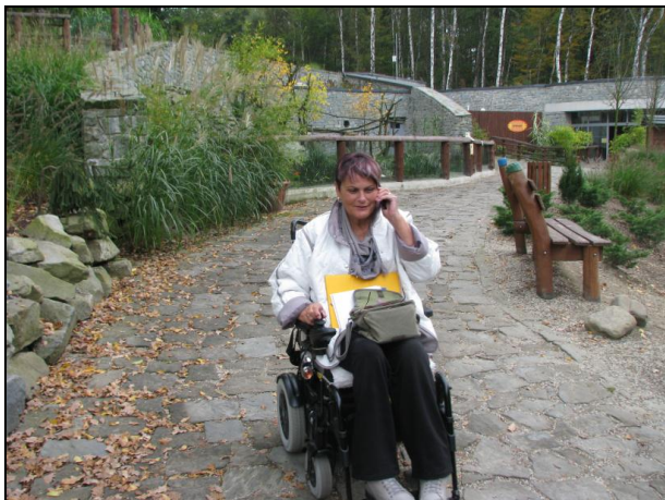
Tahle cesta je zbytečně hrbolatá, i když ji vozíčkář zvládne.