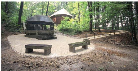
K PRAMENŮ u kaple svatého Kříže ve Fryčkově-Místku v městské části Lískovec-Hájek vede bezbariérový přístupový chodník, který ocení všichni návštěvníci tohoto místa.

Smyslem projektu je propagovat přístupné cestování a podněcovat k jeho rozvoji jak poskytovatele služeb cestovního ruchu, tak osoby s omezenou schopností pohybu a orientace, které mohou rozšířit okruh potenciálních návštěvníků. Cílem mapování je totiž poskytnout potenciálním návštěvníkům dostatek nezkrácených informací, na základě kterých budou moci sami vyhodnotit přístupnost konkrétního cíle s ohledem na své potřeby a očekávání. Mapování bude probíhat do března příštího roku. Výsledky budou poté zpracovány do típů na výlety a zveřejněny na portálu www.jednotlivky.cz . Proces mapování je však ještě na začátku. Žádá se, že největší překážkou v jeho intenzivnějším rozvoji je malý zájem provozovatelů o tuto bezplatnou službu. Přitom hodnotitelé potřebují pouze jejich souhlas. Zbytek už znějí, popřípadě a mařou sami.